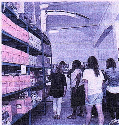
A Lodi il centro di raccolta solidale per il diritto al cibo dove gli studenti sospesi di Lodi sono stati mandati a rendere servizio